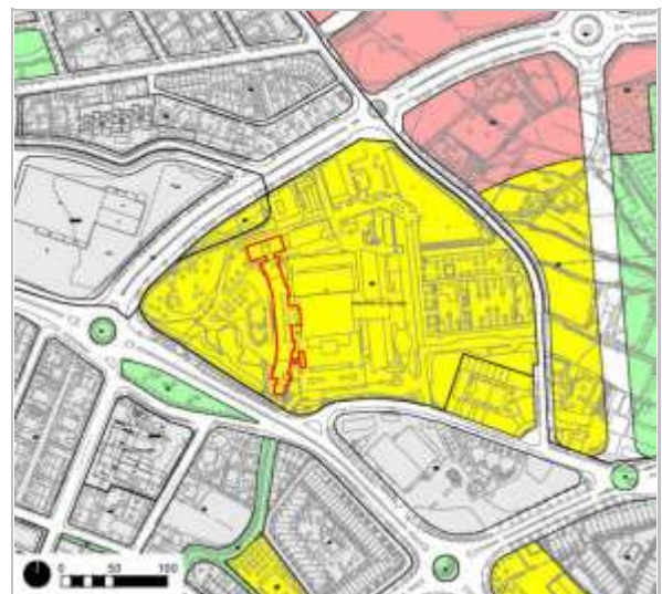
Planejament Vigent (Refós 2021)

Tipus de bé Element d'interès històric, artístic i arquitectònic